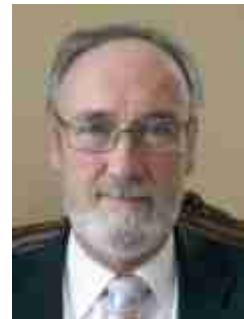
Профессор Эндрю Воллард, Директор МБМВ

Одним из преимуществ быть исследователем в области метрологии является то, что она продвигает нас на передний край науки. Мы всегда стараемся понять, почему природа ограничивает наши способности производить точные измерения, а затем спрашиваем себя, является ли это ограничение фундаментальным или с появлением некой умной идеи, мы можем идти дальше. Интеллектуальный вызов - это могущественная сила, способная открывать неизведанные области.